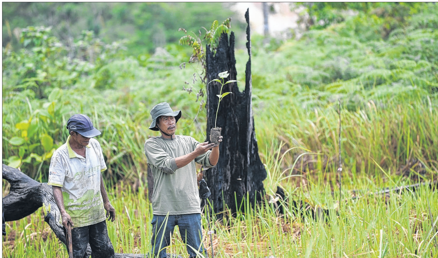
Fairventures arbeitet gemeinsam mit den Bauern Zukunftspläne aus.